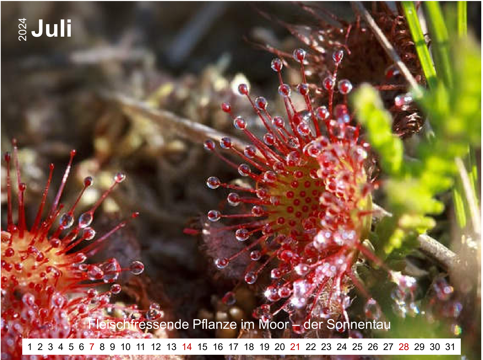
Fleischfressende Pflanze im Moor – der Sonnentau

1 2 3 4 5 6 7 8 9 10 11 12 13 14 15 16 17 18 19 20 21 22 23 24 25 26 27 28 29 30 31