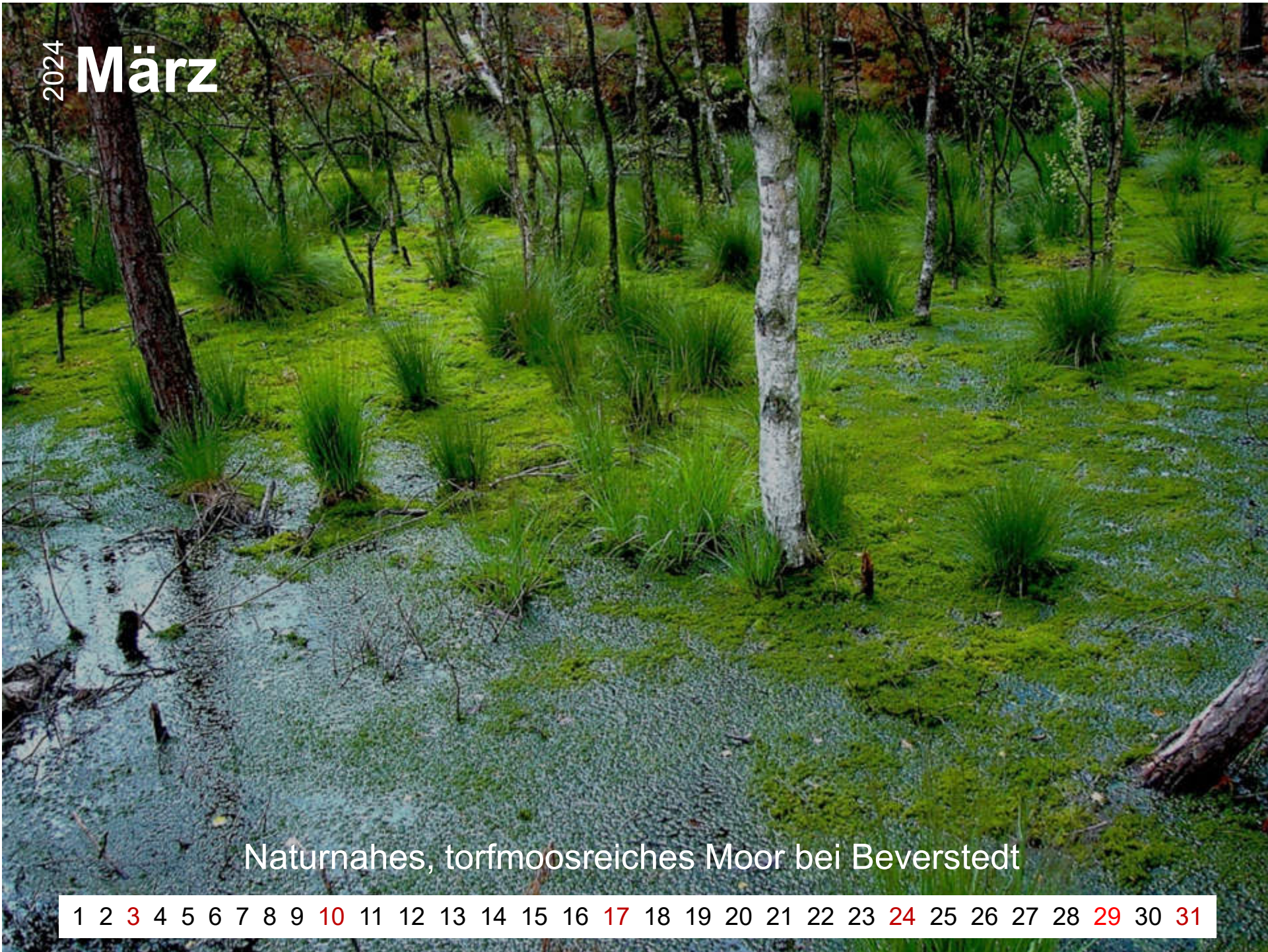
Naturnahes, torfmoosreiches Moor bei Beverstedt

1 2 3 4 5 6 7 8 9 10 11 12 13 14 15 16 17 18 19 20 21 22 23 24 25 26 27 28 29 30 31