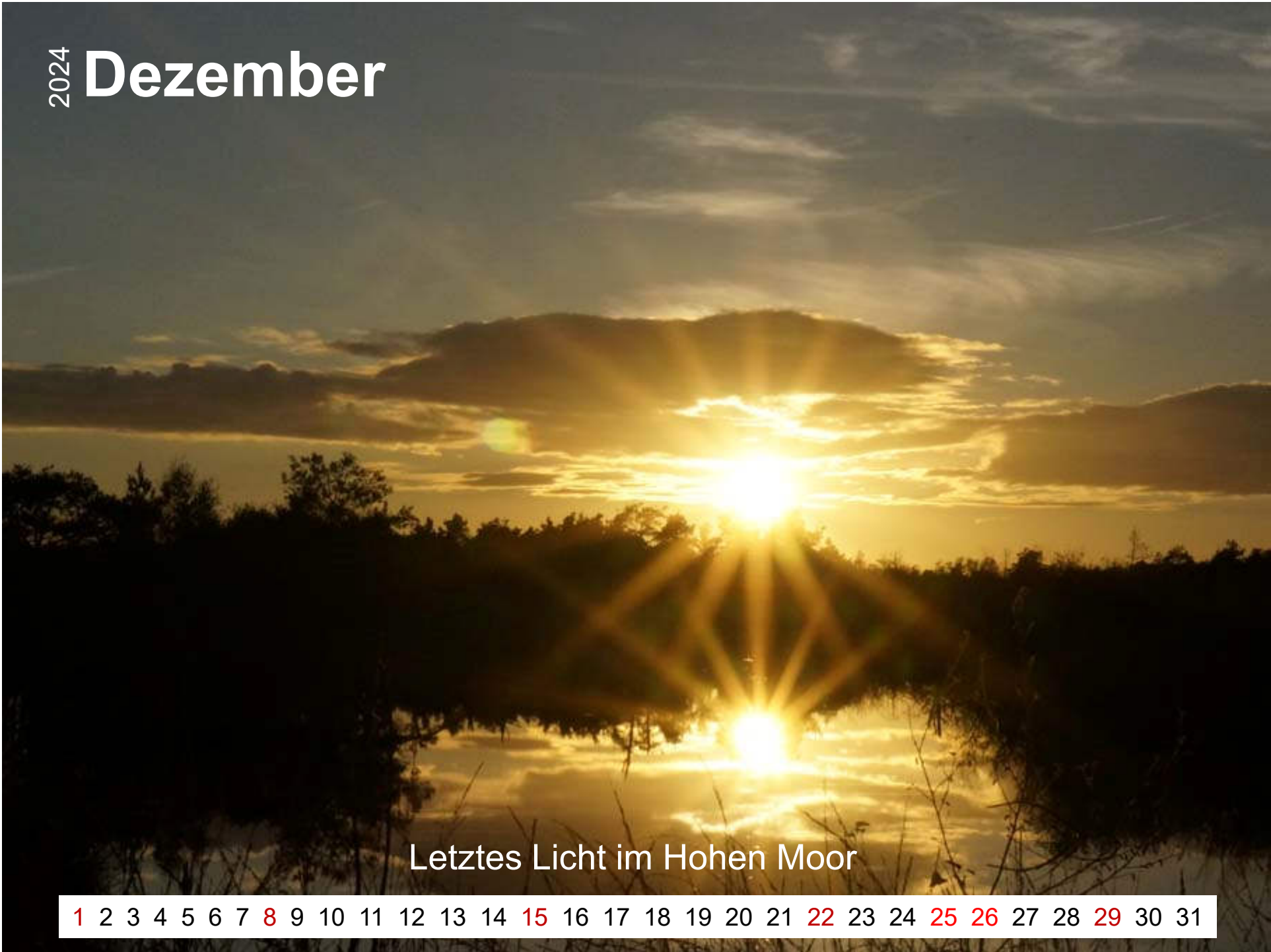
Letztes Licht im Hohen Moor

1 2 3 4 5 6 7 8 9 10 11 12 13 14 15 16 17 18 19 20 21 22 23 24 25 26 27 28 29 30 31