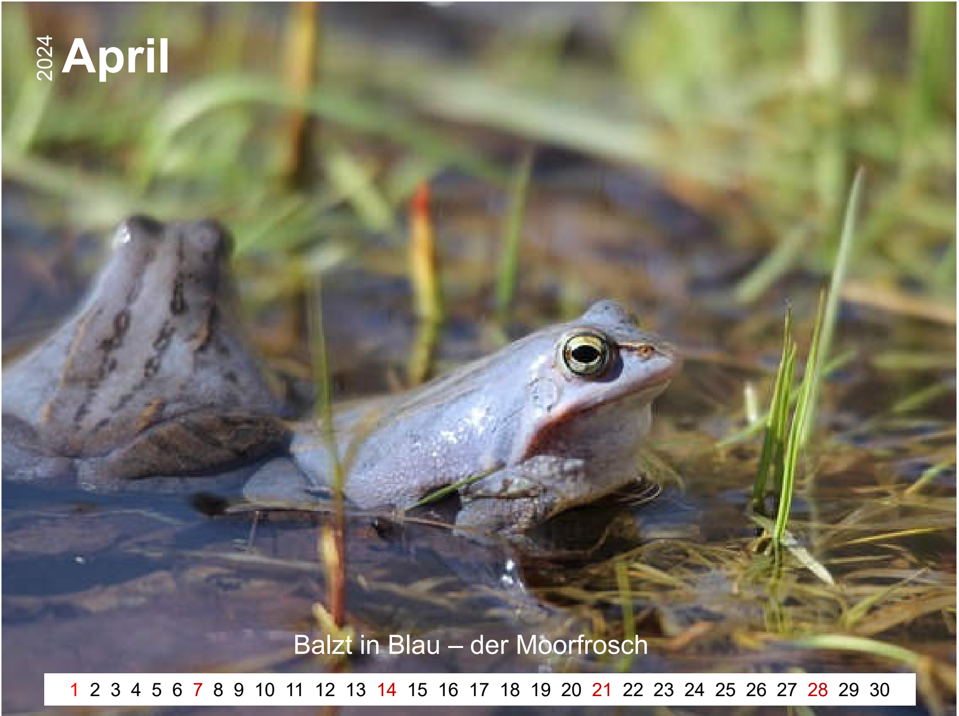
Balzt in Blau – der Moorfrosch

1 2 3 4 5 6 7 8 9 10 11 12 13 14 15 16 17 18 19 20 21 22 23 24 25 26 27 28 29 30