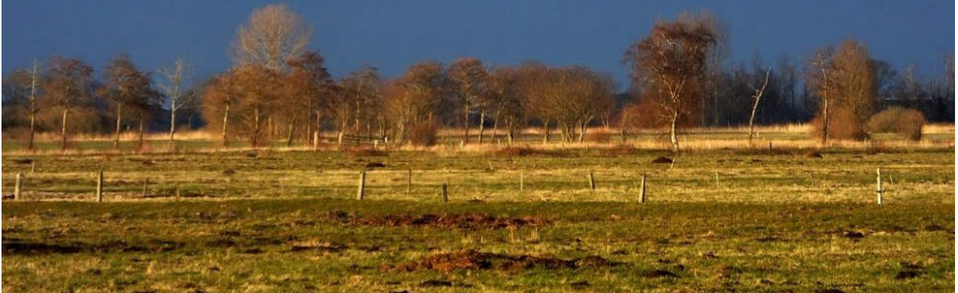
Moorlandschaft der Wesermarsch im Winter

1 2 3 4 5 6 7 8 9 10 11 12 13 14 15 16 17 18 19 20 21 22 23 24 25 26 27 28 29 30